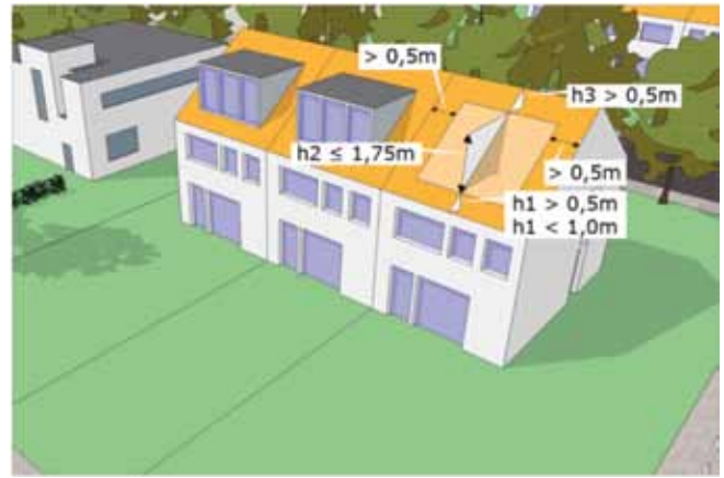
Een dakkapel die voldoet aan de in bovenstaand tekening gegeven afmetingen mag zonder omgevingsvergunning geplaatst worden

In de planologische regelgeving (bestemmingsplan of beheersverordening) legt de overheid regels vast voor de ruimtelijke ordening. Deze regels zijn bindend voor u als burger. In een bestemmingsplan of beheersverordening is aangegeven welke bestemming de grond heeft en welk gebruik is toegestaan. Bijvoorbeeld woningbouw, industrie, winkels, recreatie of kantoren. Die verschillende bestemmingen zijn op een plankaart weergegeven en in de planvoorschriften zijn de daarbij behorende regels voor het bouwen en het gebruik gegeven. Tenzij uw bouwplan vergunningvrij is, moet voldaan worden aan die bouw- en gebruiksregels.