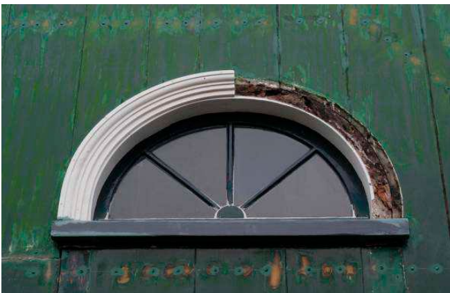
Herstel houtwerk vergunningvrij als detaillering, profilering, vormgeving, materiaal-soort en kleur dezelfde blijven