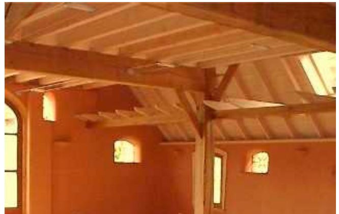
Aanbrengen binnenisolatie. Vergunning nodig.