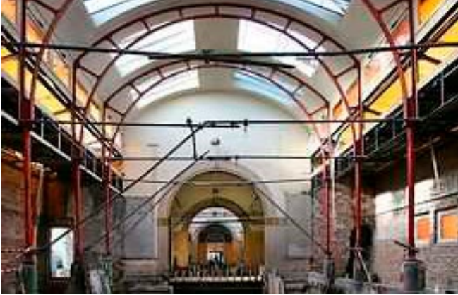
Volledig cascoherstel. Vergunning nodig.