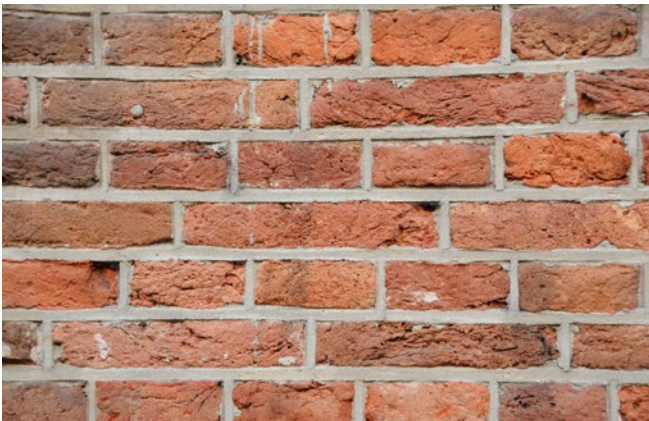
Volledig vervangen van voegwerk. Vergunning nodig.