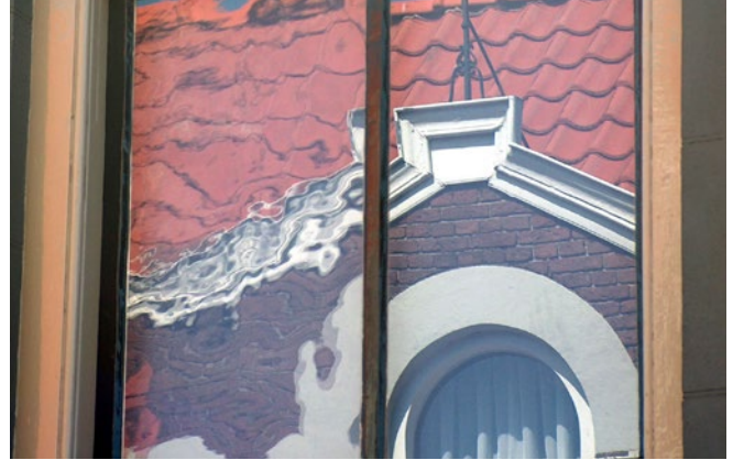
Vervanging van oorspronkelijk mondgeblazen glas (links) door modern glad floatglas (rechts), beide in een oud raam. Vergunning nodig.