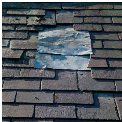
Aangevuld met dezelfde soort leien en hetzelfde gekkingspatroon: vergunningvrij