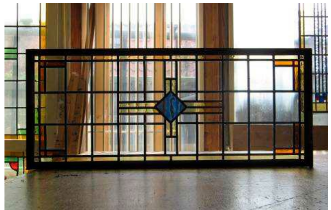
Glas lood raam uitgenomen, hersteld en met dezelfde glassoort teruggeplaatst: vergunningvrij