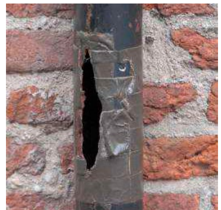
Kapotte delen van de hemelwaterafvoer met hetzelfde materiaal vervangen: vergunningvrij