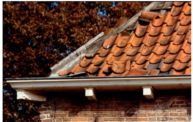
Herstel lood en pannen conform bestaande toestand: vergunningvrij