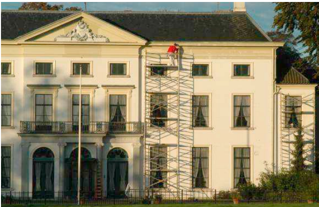
In dezelfde kleur overgeschilderd: vergunningvrij